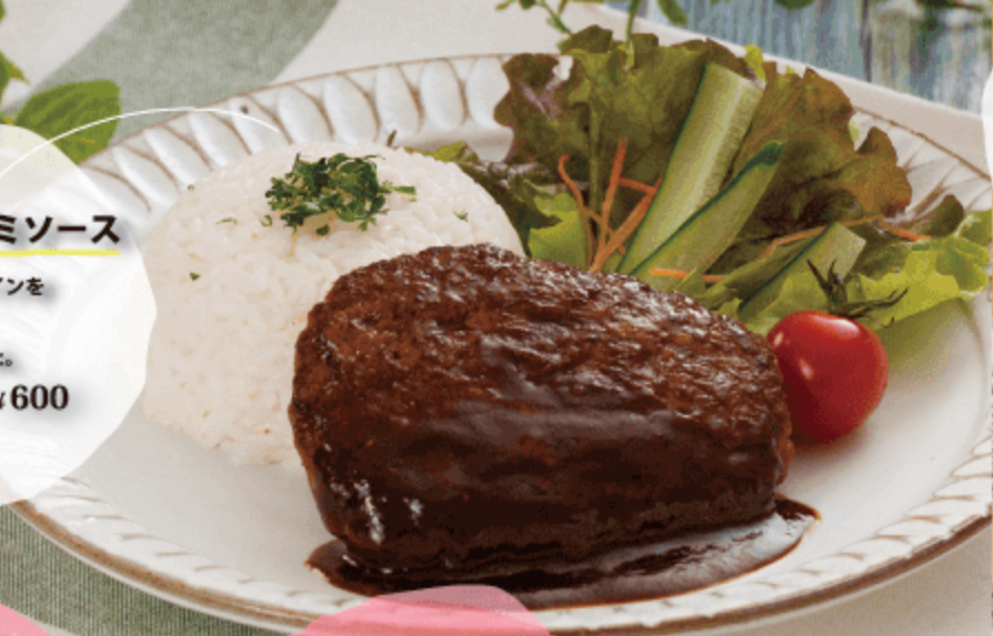
ハンバーグプレート デミソース