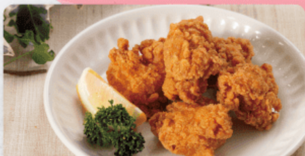
鶏の唐揚げ メンバー ¥400 ビジター ¥500