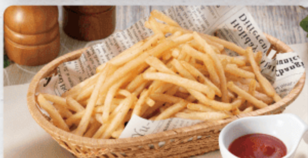
大盛りポテトフライ メンバー ¥200 ビジター ¥300